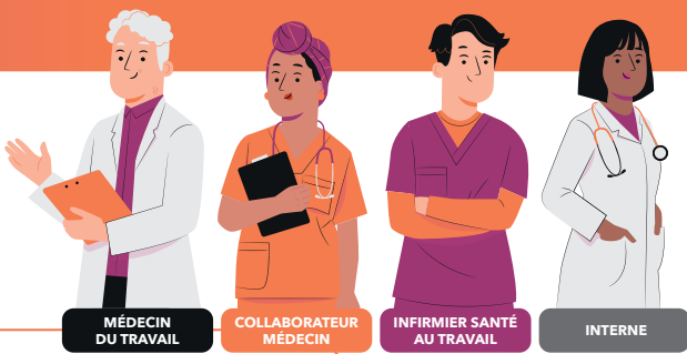
MÉDECIN DU TRAVAIL